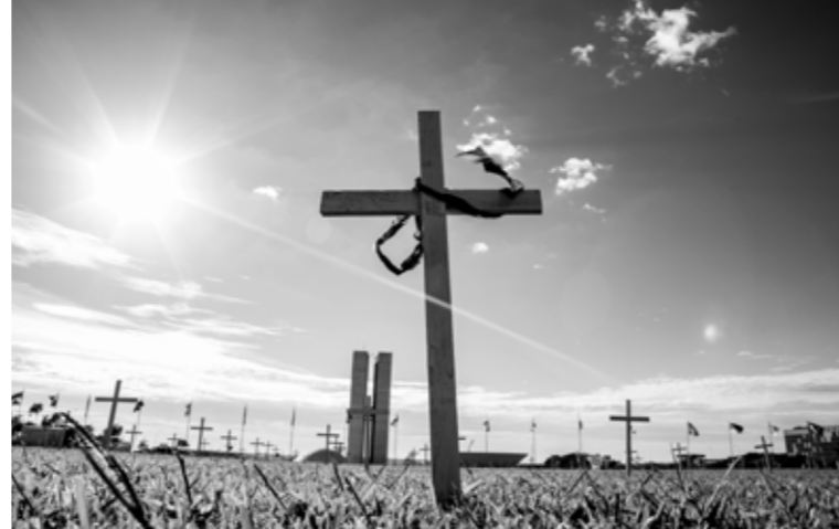
Legenda da foto legenda da foto

você terá o tempo mínimo de contribuição exigido e veja se você terá a idade mínima exigida no ano. Isso porque a idade mínima irá aumentar um ano a cada dois, conforme determinam as regras da PEC 287-A.