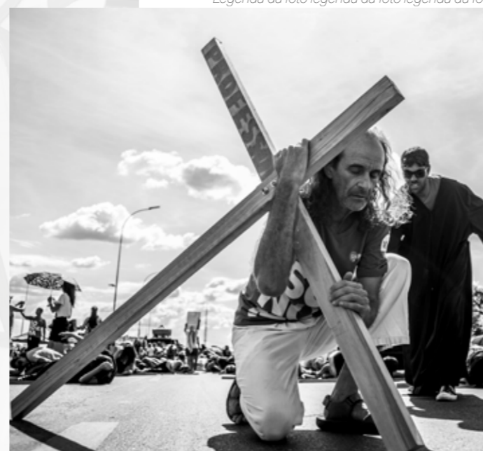
Legenda da foto legenda da foto legenda da foto

Todavia, para a professora do exemplo ter o direito de receber 100% dessa média, ela terá de trabalhar 40 anos e, ainda que receba 100% do valor da média, o benefício será menor do que o valor da regra atual.