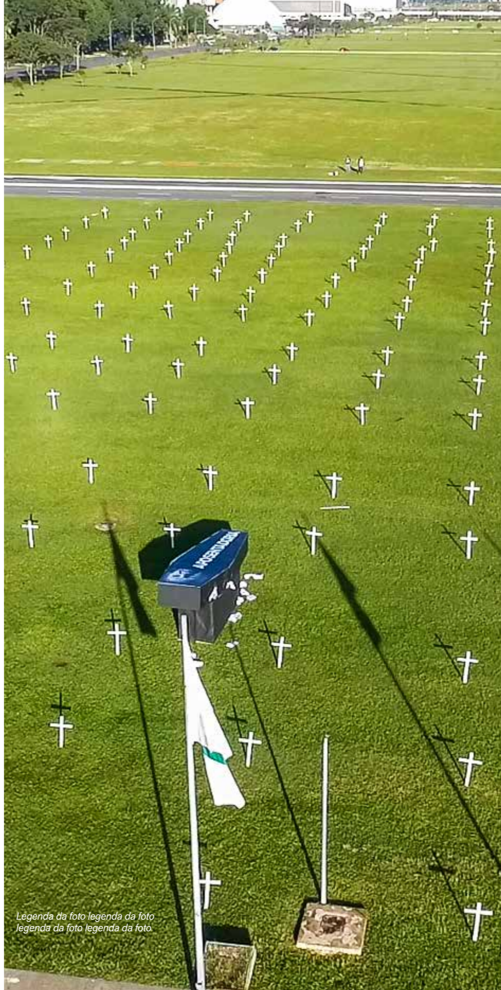
Legenda da foto legenda da foto legenda da foto legenda da foto